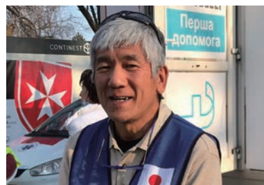
2022.3.15 ハンガリー国境の村 Beregsurany にて現地団体とウクライナ避難者への医療支援を開始

持続可能な循環型地域社会の構築をザンビアと徳島で目指し、活動する。TICO の代表であり、自身が運営する診療所の医院長でもある。自称兼業農家でありながら、趣味は手術と医者魂は押さえている。(TICO ホームページより)