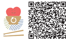
▲フードバンクとくしまのFacebookページへ