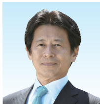
景治 信良 町長

徳島勤労者福祉サービスセンターの会員の皆様におかれましては、ますますご健勝でご活躍のことと、心よりお慶び申し上げますとともに、日頃より町政各般にわたり、格別のご支援とご協力を賜り、厚くお礼申し上げます。