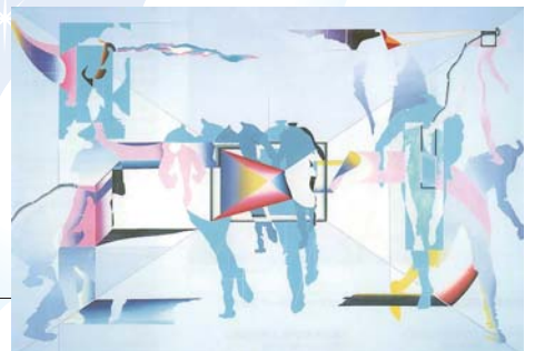
(徳島県立近代美術館所蔵作品)

宇佐美圭司 メナム河畔に出現する水族館 1967年 油彩 キャンバス 185.4×270.3 cm