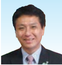
三浦 茂貴 町長

「あわ～ず徳島」会員の皆さんこんにちは！海陽町長の三浦茂貴です。 コロナが5類になり、日本全国がこれからという時に光熱水費などの物価高騰、さらに異常な円安により、中小企業を取り巻く環境は非常に厳しいものとなっています。